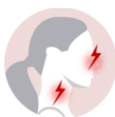
Comichão no nariz e garganta