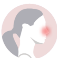
Congestão nasal (nariz entupido)