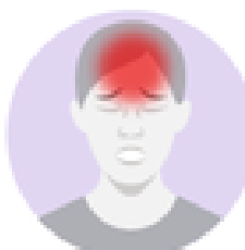
Dor de Cabeça