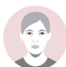
Irritação nos olhos